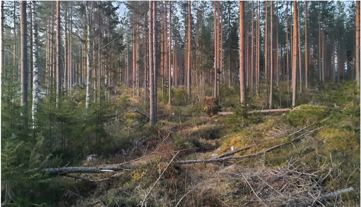
Kuva 3-1. Metson soidinympäristöä selvitysalueella.