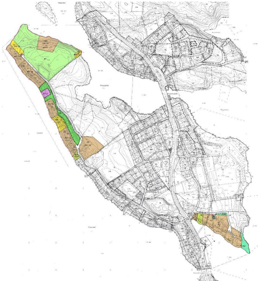
Kuva 3. Ote asemakaavayhdistelmästä.